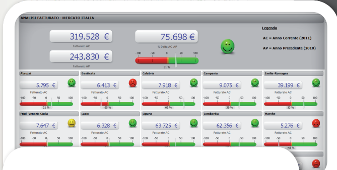
Analisi mercato italiano: fatturato per regione