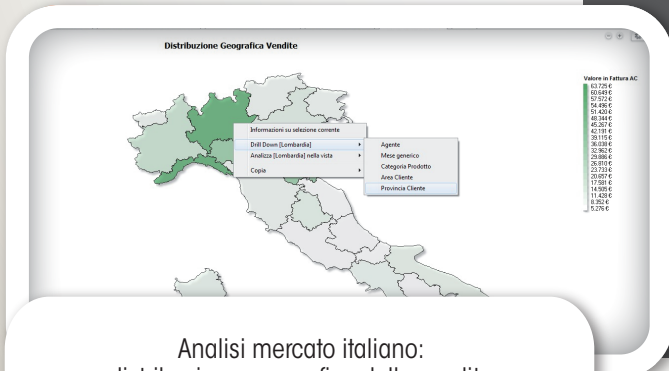
Analisi mercato italiano: distribuzione geografica delle vendite