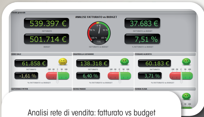
Analisi rete di vendita: fatturato vs budget